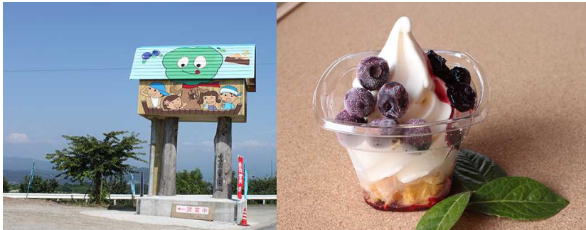
広大な希望の丘農園・つぶべりソフト：イメージ